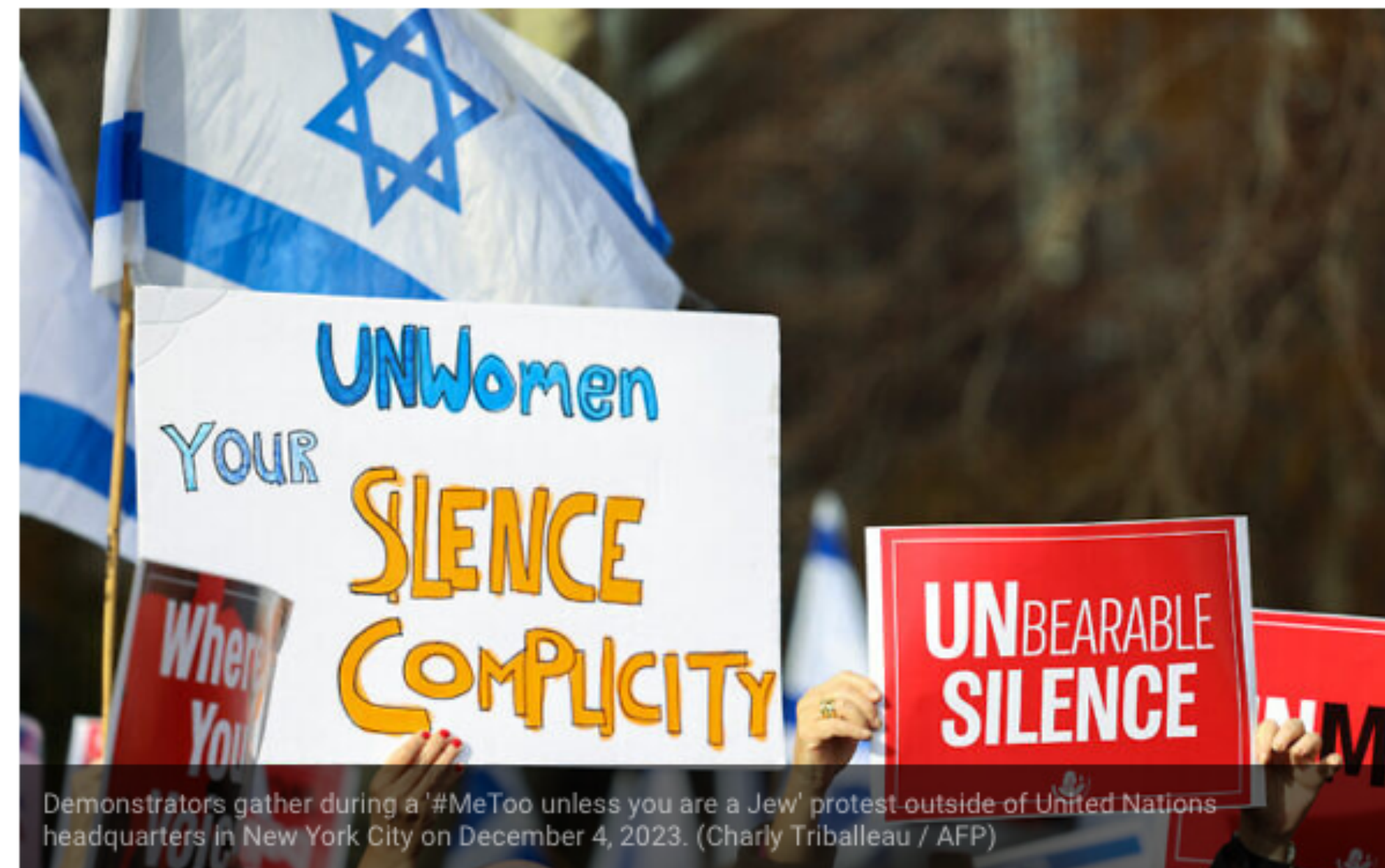
Demonstrators gather during a '#MeToo unless you are a Jew' protest outside of United Nations headquarters in New York City on December 4, 2023.