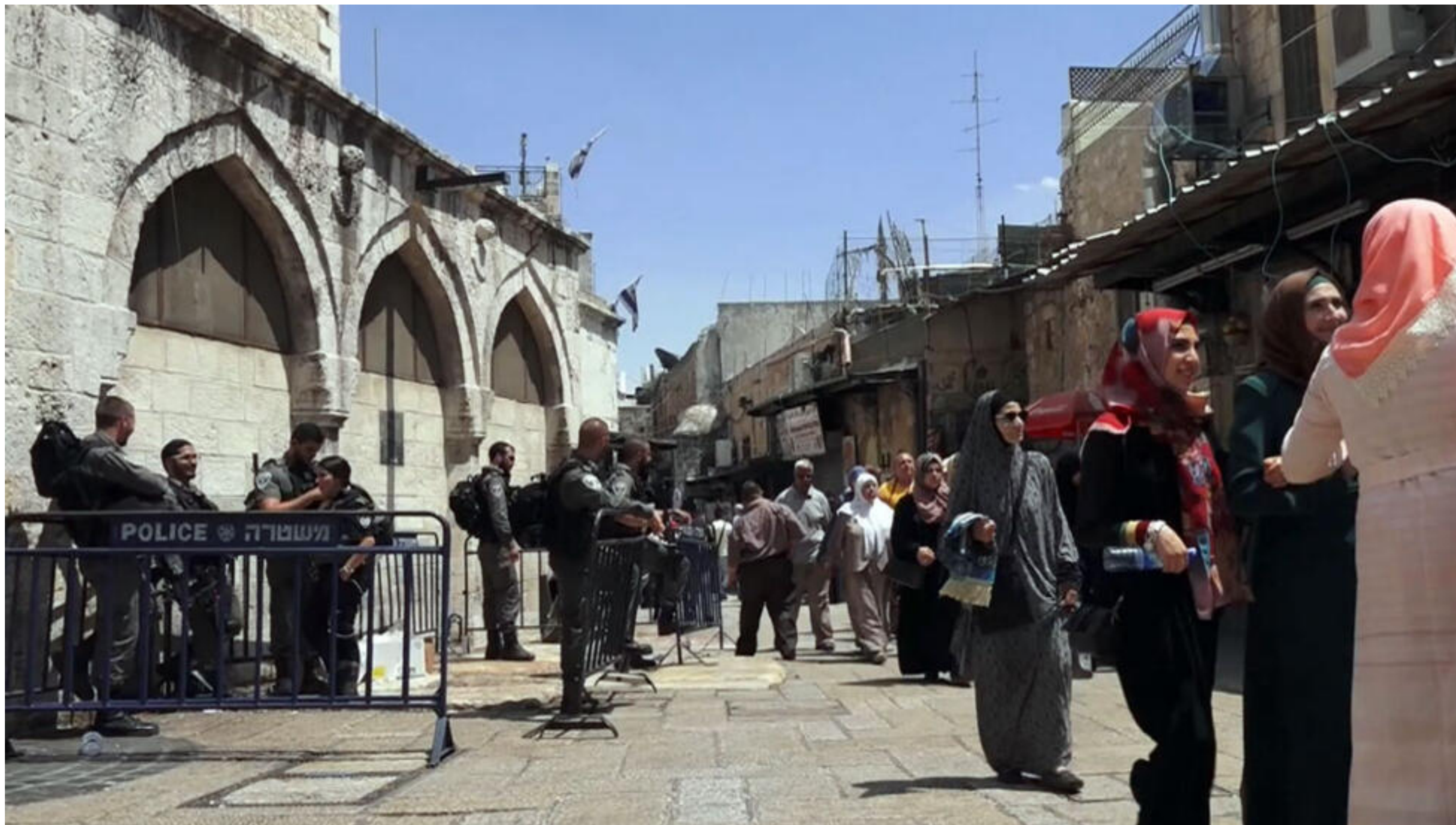
東耶路撒冷，伊斯蘭教區